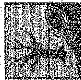
PERICOLOSO FER L'AMBIENTE

Composizione di BOLERO MICROTECH Acetochlor puro g. 36,7 (-400 g/l) Dibromometil g. 6,13 (-66,7 g/l) Completamento q. acq. g. 100